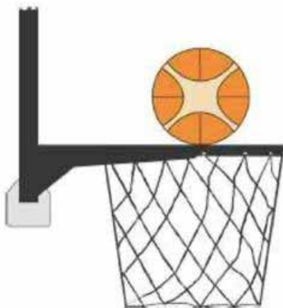
Figura 3 Palla a contatto con l'anello

31-19 Precisazione. Una violazione per interferenza è commessa da un difensore o da un attaccante durante un tiro a canestro su azione allorché un giocatore tocca il canestro (anello o retina) o il tabellone, mentre la palla è a contatto con l'anello ed ha ancora la possibilità di entrare nel canestro.