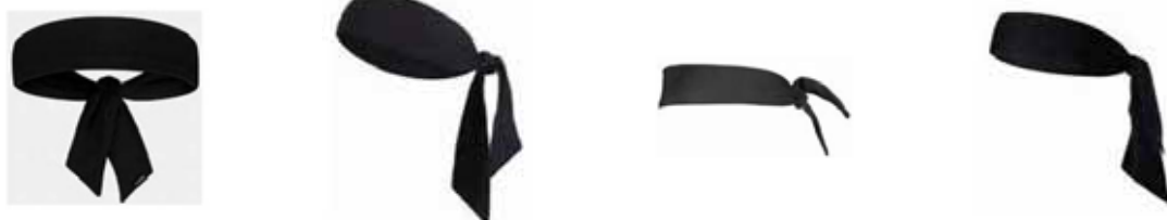
Figura 1 - Esempi di bandane

4-4 Precisazione: Non è consentito indossare bandane.