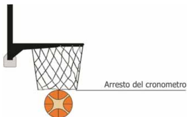
Figura 2 - Canestro realizzato

il cronometro di gara deve essere fermato quando la palla è passata interamente dal canestro come mostrato nella Figura 2.