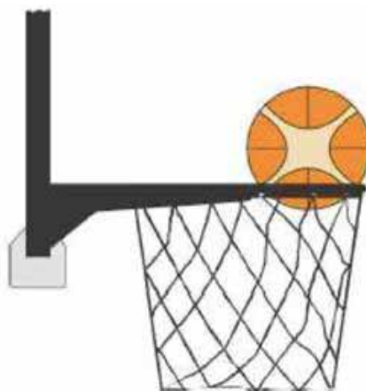
Figura 4 - Palla dentro il canestro

31-24 Precisazione. Si verifica una violazione per interferenza se un difensore tocca la palla mentre questa è dentro il canestro